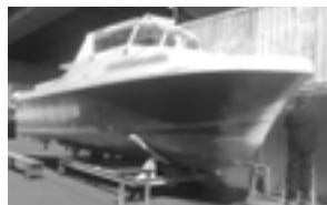
船はハル塗装等の浜寺ボートが培ったレストア技術によって長く愛される船に変わる