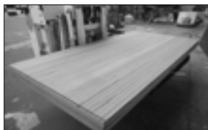
オーナーのDIYブームで、人気のチークスライプ合板は31,500円(送料別)

「変化のスピードは速く、マーケットのニーズを的確に捉えるのは難しい時代。その中で当社もフレキシブルな会社になることを求められていると思います。個性的なオーナーに負けないくらい個性的な商品やサービスを提供し、お客様にとって身近で、かつ多くの機会に接する会社を目指していきます。当社には技術や経験といったしっかりとしたベースがあります。これからも次の一手どころか二手も三手も考えていきますよ」