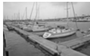
1tあたり月額735円のバイバイバースも人気、随時受付中